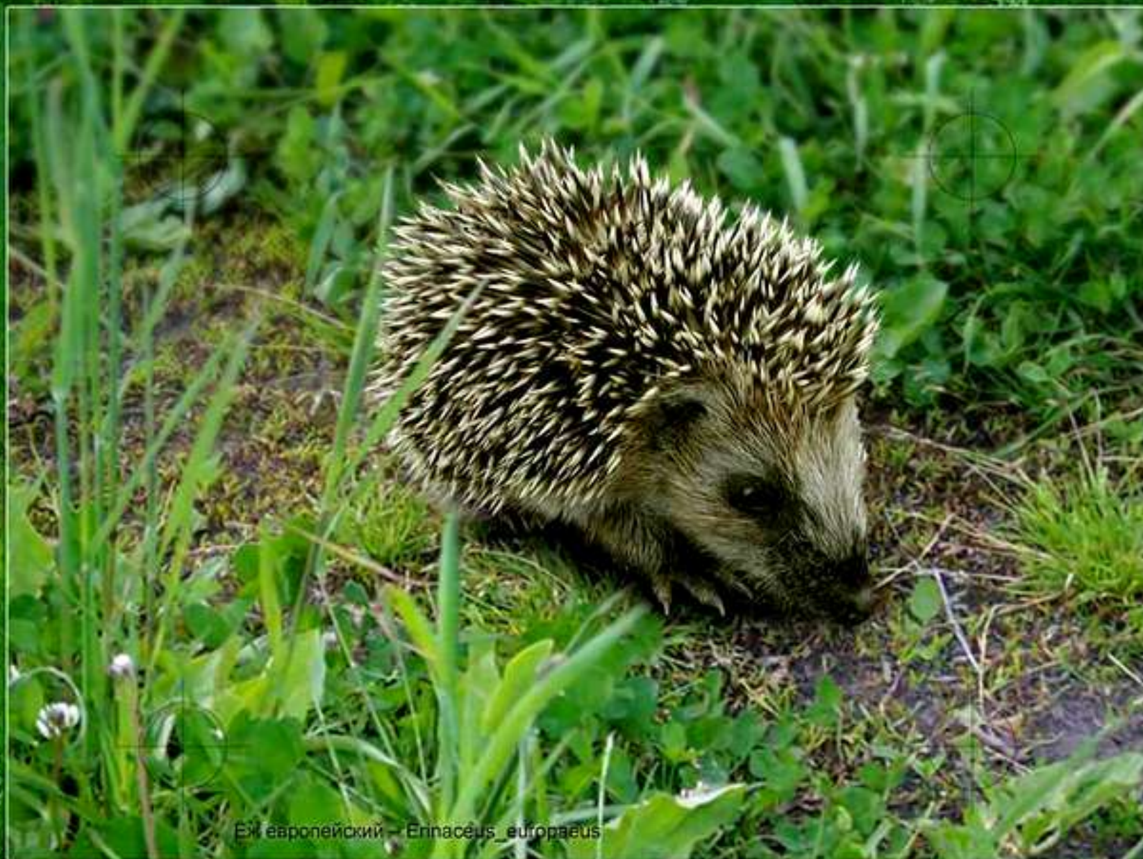
Еж европейский – Erinaceus europaeus