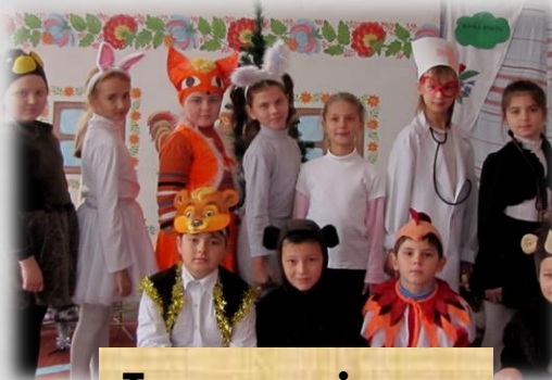
Театралізова ні дійства